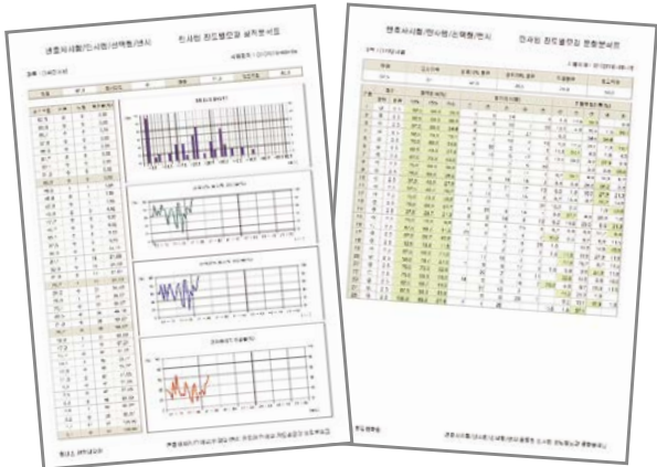
〈 선택형 통계 샘플 〉