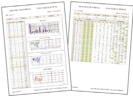
▲ 선택형 성적처리 통계 샘플