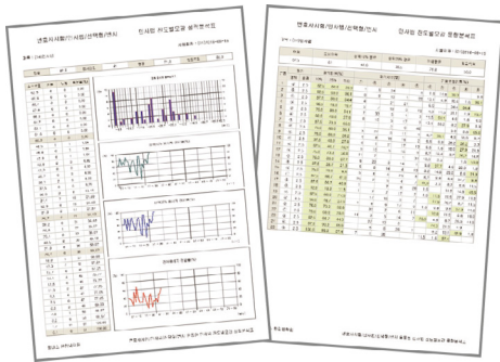
▲ 선택형 성적처리 통계 샘플