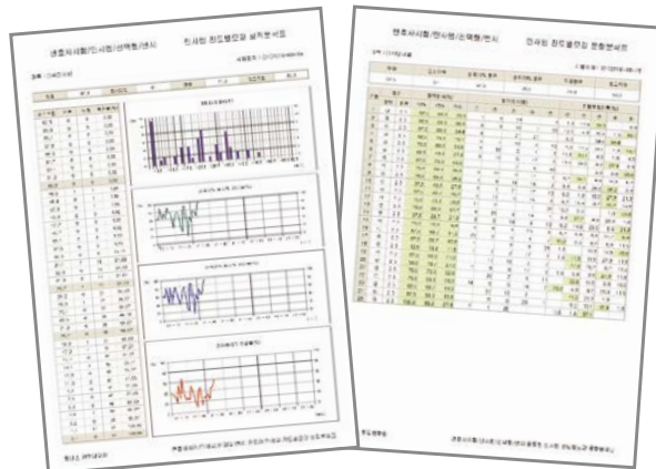
〈 선택형 통계 샘플 〉