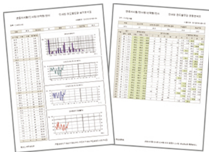
▲ 선택형 성적처리 통계 샘플